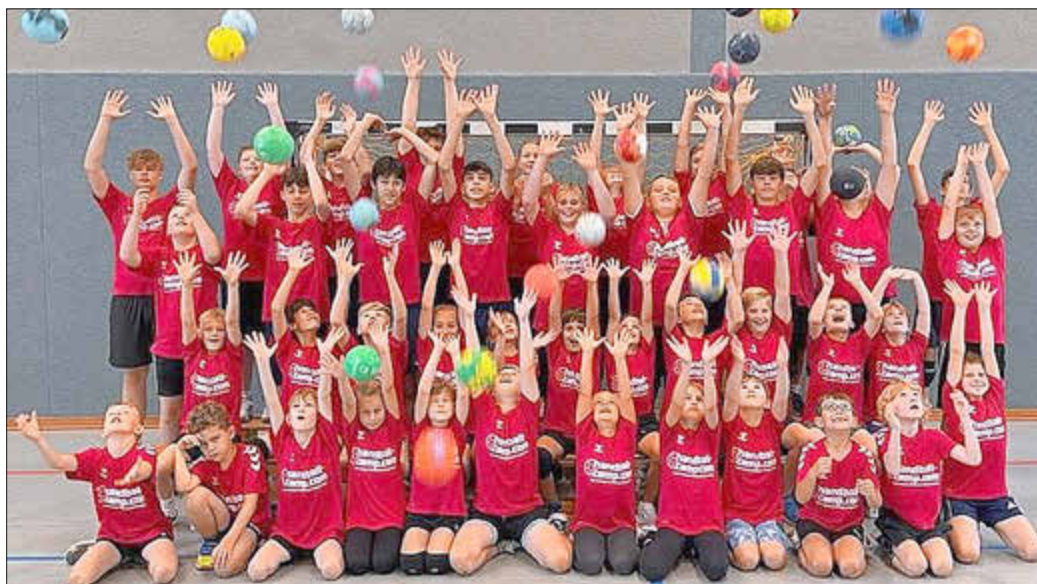
Elternfoto im Auftrag des SSV: „Teilnehmer der Handballcamps“