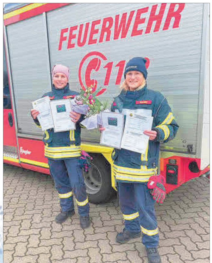
Die 2 Kameradinnen der FF Wiendorf

Kommt immer gesund aus euren Einsätzen zurück