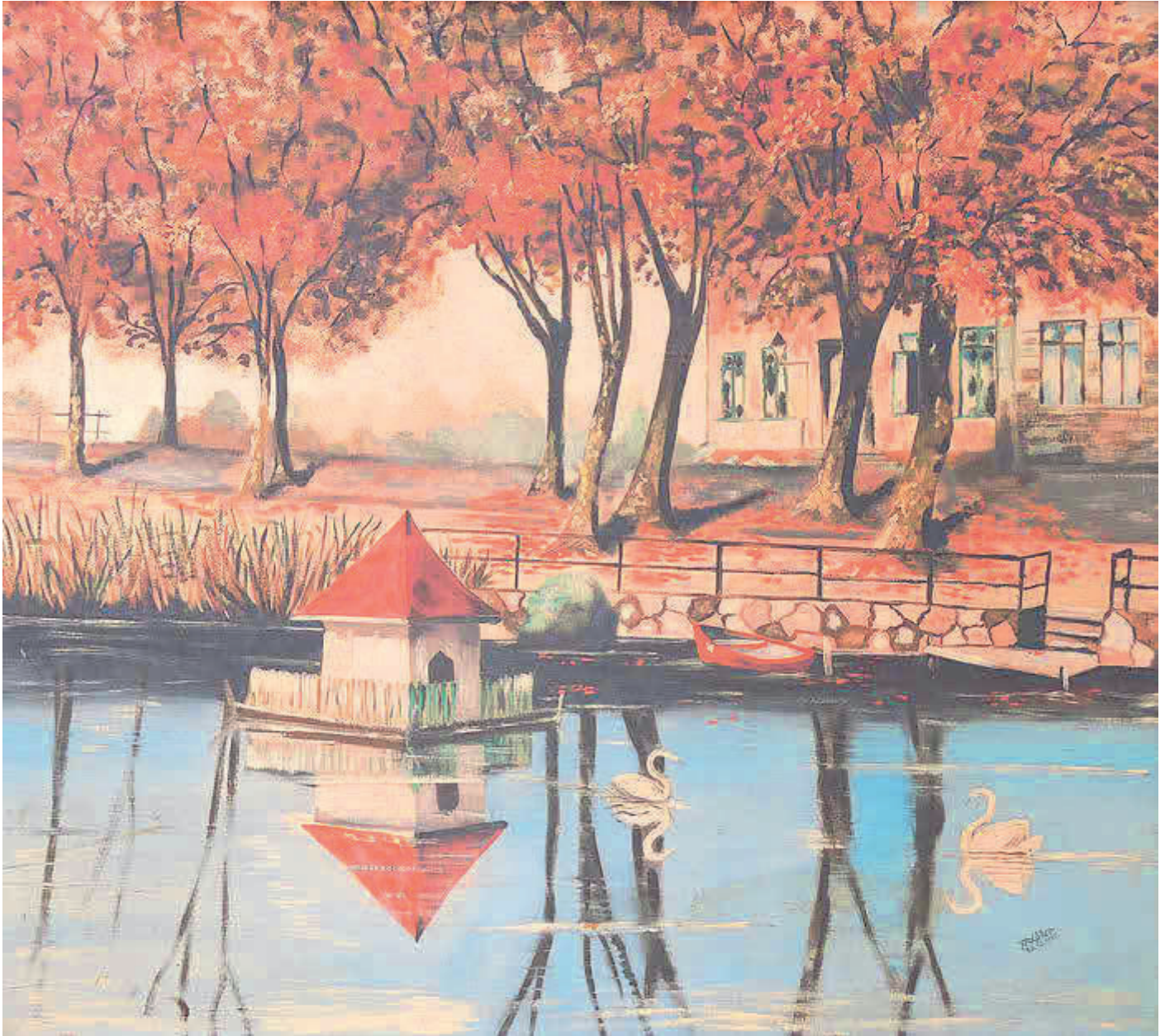
Willi Möller, Der Mühlenteich mit Schwanenhaus

16. Januar 2026 | Ausgabe 1 | Jahrgang 8