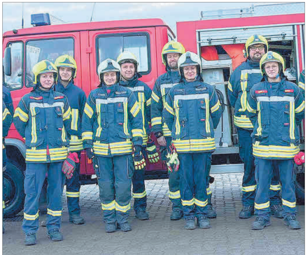
Alle Truppfrauen/ männer 2025 die an der Truppmannausbildung im Amt erfolgreich teilgenommen haben

Einige von ihnen tun dies bereits seit längerer Zeit und