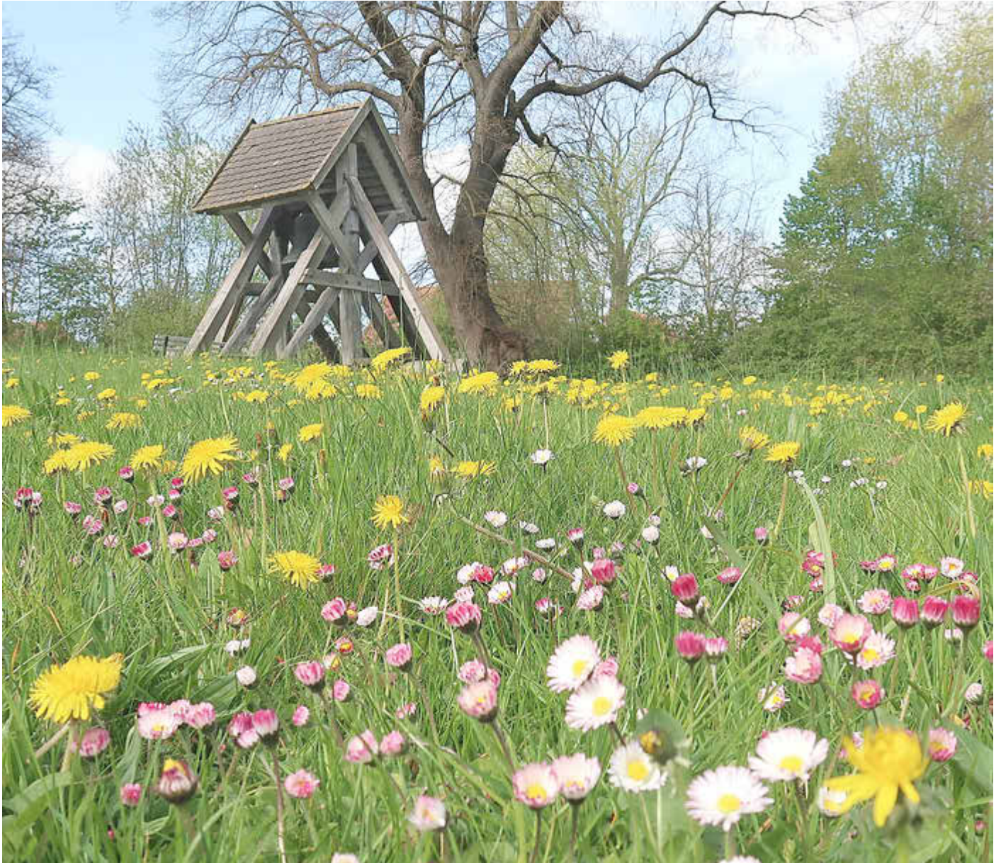
Glockenstuhl in Groß Grenz